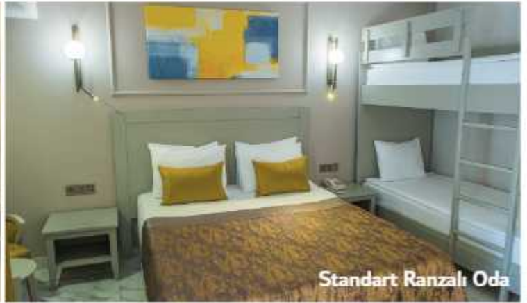
Standart Ranzalı Oda