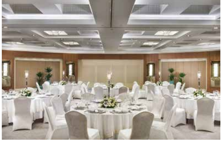
Meeting Room 1+2+3 Banquet Style