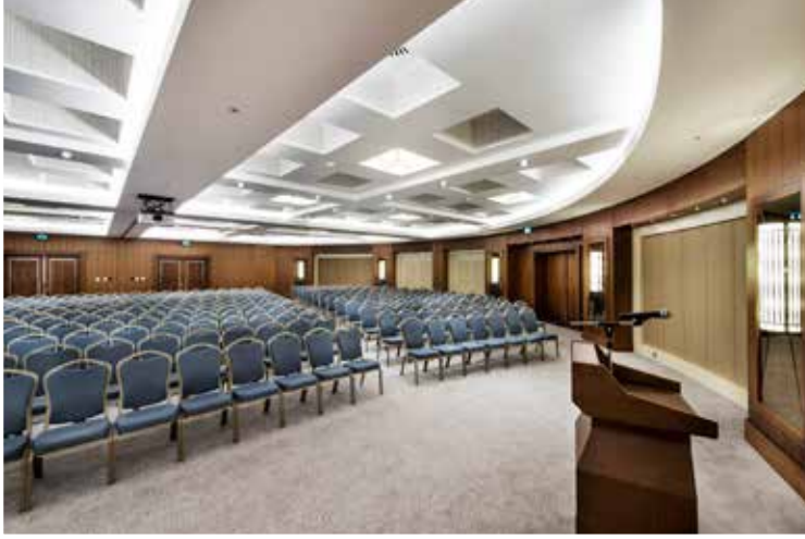
Meeting Room 1+2+3 Theater Style