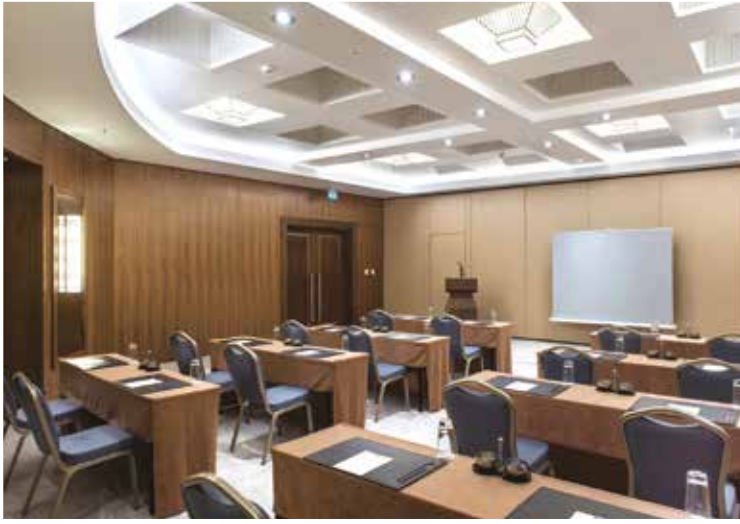
Meeting Room 1+2+3 Classroom Style