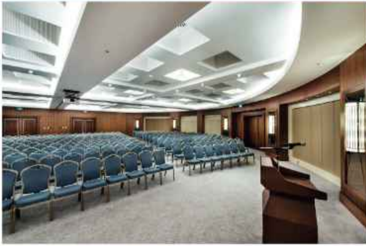
Meeting Room 1+2+3 Theater Style