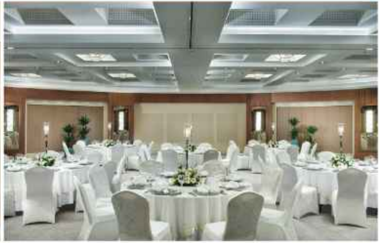
Meeting Room 1+2+3 Banquet Style