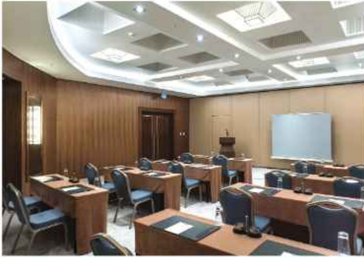
Meeting Room 1+2+3 Classroom Style