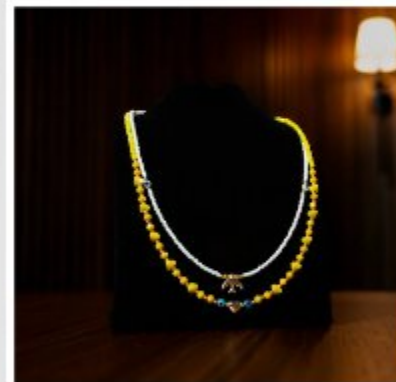
Ожерелье солнечного света