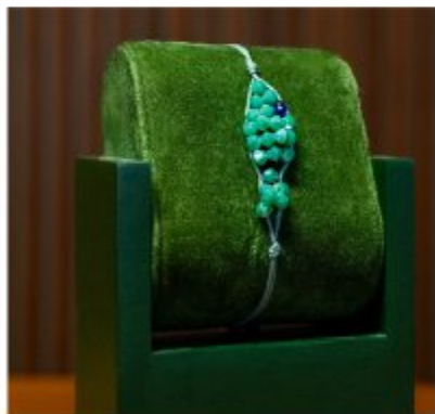
Браслет Мир Природы