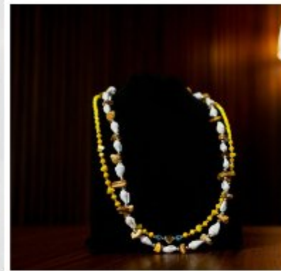
Ожерелье из натурального моря