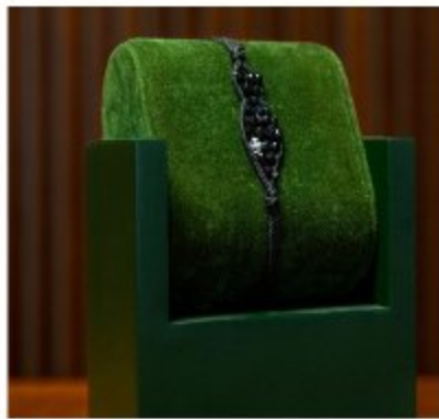
Ночной светящийся браслет