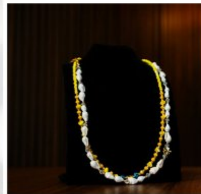
Колье «Летний бриз»