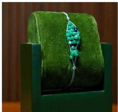
Frieden der Natur-Armband