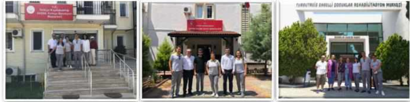
Huzurevi ve Çocuk Evi Ziyaretleri