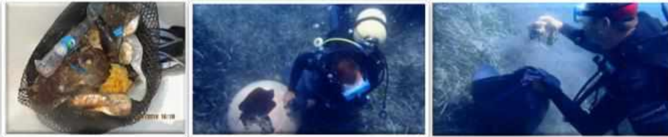
Deniz dibi Temizliği