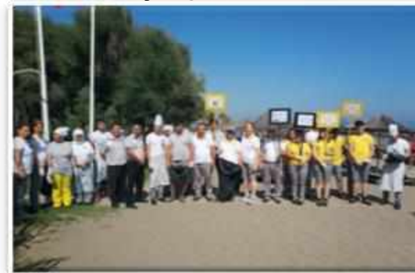
Dünya Çevre Günü