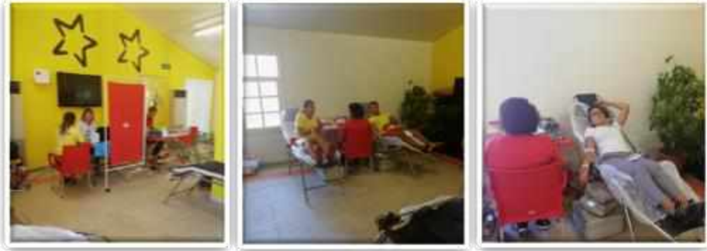
Kızılay Kan Bağışı